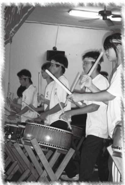
練習時的辛勤汗水是為了將來完美的演出

到許多地方去表演，甚至到國外演出。我希望孩子因為太鼓的成就感，來導引孩子對學業的興趣，甚至促成他們在學業成就上的提升。然而，經過二個多月來和孩子密切的相處，我發現孩子要的不多，他們只要快樂地打鼓，就是一切希望的泉源！