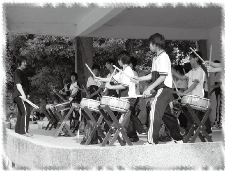
孩子用自己的努力博得鼓舞的掌聲！

要讓孩子把鼓真正學好，唯一的方式，就是不停地讓孩子表演，讓他們獲得高度的信心和成就感。5月20日就是一個開始，我們安排學生對全校同學和學區內國小師生公開演出。