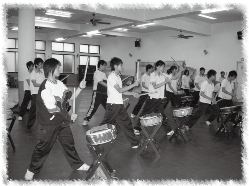
太鼓隊建立了孩子的信心，也看到了希望

國中的校長，她是我們爭取經費時的面談委員也是普仁的顧問，當我對寶中的計畫作完簡報時，她熱情地告訴我，寶中學生因弱勢而學測成績不佳的情形與她的學校相仿，但他們力圖振作，不僅破除了教育部的列管，而且考上公立學校的學生數大幅提升，實在令人驚訝與佩服。也因此，我們兩校開啟了一連串的拜訪與對話，為我們帶來許多寶貴的成功經驗。