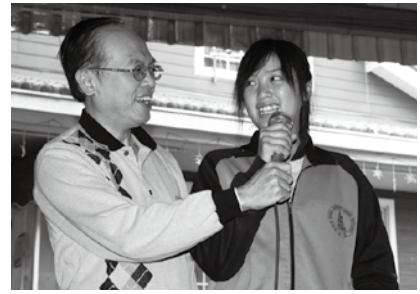
與孩子的相處帶給呂執行長意外的收穫！

很累贅地和大家分享一些心路過程，如果能從字裡行間，讓伙伴、讓讀者感受到些許滋潤，我才對得起大家，我們因普仁基金會而結緣更是值得，希望這種體驗，不僅是捐款、不僅是人情、不僅是付出、奉獻，而