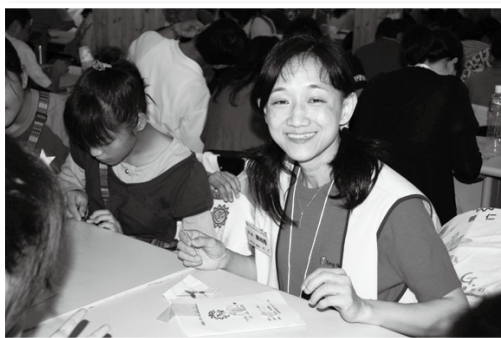
微小的善意也能讓人感受到生命的光和熱。

儘管遊戲終了時，我只進化至超人，可是在整個互動過程中，就如同近來我的體會般——事實上“人”是相當軟弱的，需要同伴們相扶持；在有危（急）難時，自己更要主動「開口求援」，才會有貴人相助！生老病死及無常均會出現在每個人的生命中，若能寬心看待，不也都為我們的人生路增添了幾許曲線和高低潮。