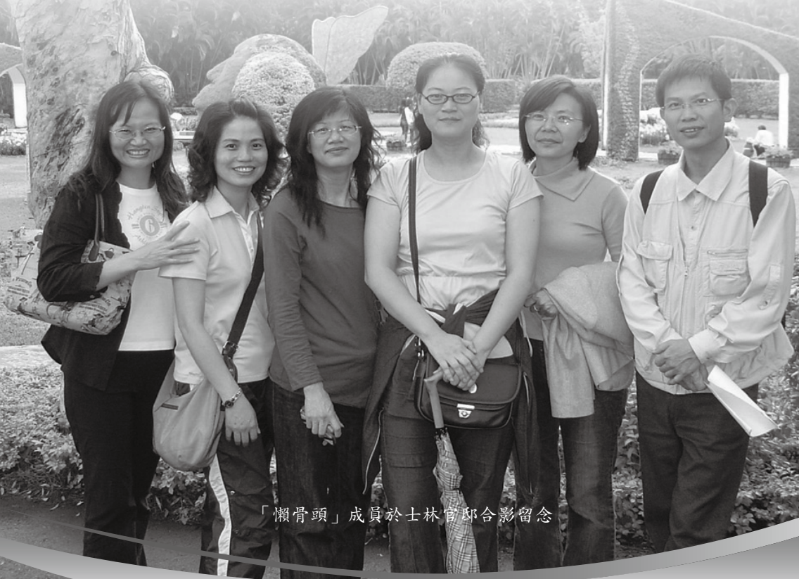
「懶骨頭」成員於士林官邸合影留念

大家聊得意猶未盡，遲遲不肯離開，餐廳服務人員已經不管我們了，我們還自己去加茶水喔！真是拍謝（台語）!!後來實在是不行了，非走不可，眼看著天空竟然出現了太陽，藍藍的天—怎可錯過？於是提議大家到士林官邸走走，一來符合今天的踏春，二來吃得飽飽的，順便來一個飯後散步囉！真是一舉兩得！