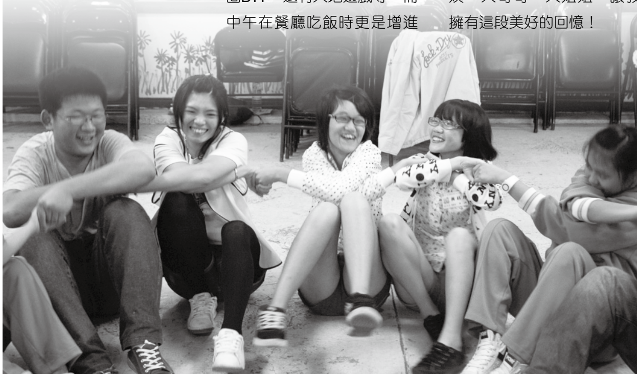
相見歡活動讓彼此都擁有美好的回憶！

回程時，我拖著疲累的身軀在想，如果能夠多舉辦這種活動那該有多好，能增廣見聞、交許多朋友，但這種活動極為稀少，更應該把握住才行！感謝叔叔、阿姨、大哥哥、大姐姐，讓我擁有這段美好的回憶！