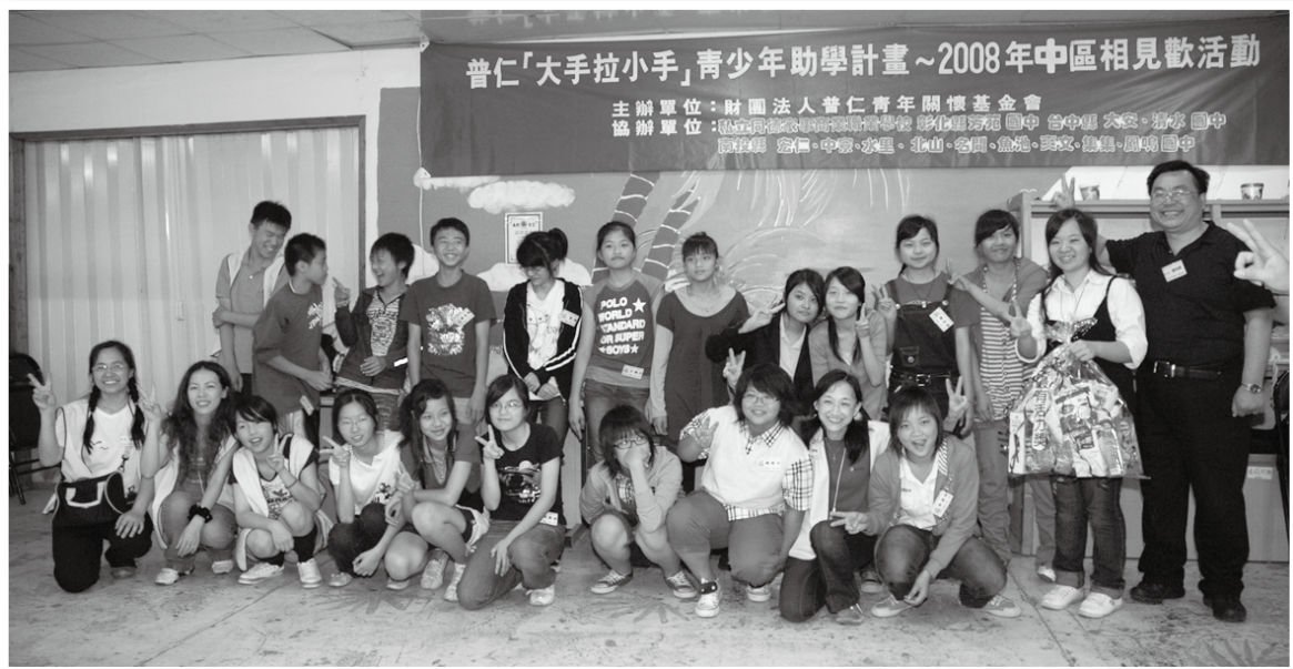
從一系列的遊戲中讓人深深體會施與受皆有福的道理