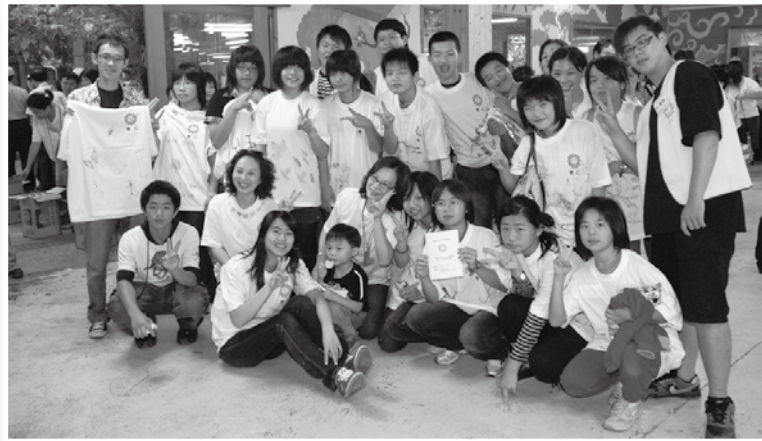
普仁相見歡活動串起了彼此幸福的緣分。

不過，我還是很高興認識了他們，讓我多了幾個朋友，我會很珍惜這些美好的回憶的，最後，再一次謝謝普仁基金會，也希望將來還能跟大家見面！