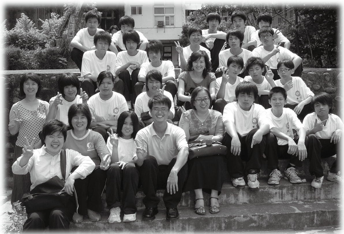
普仁邀請您一起來感動與心疼青少年朋友。

普仁由衷邀請各界有心關懷青少年的朋友一起來做偉大平凡事，一起來感動與心疼這些學生。