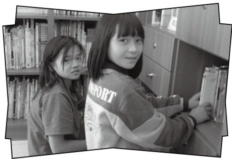
圓夢圖書室為孩子實現夢想，並開啓了閱讀的藏寶箱