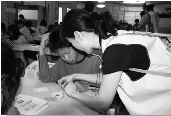
對於弱勢的學童要付出更多真誠的關懷

文化刺激、社經地位較低及語言模仿學習的情況下，孩子較常在發展上有比同儕遲緩的現象。