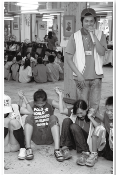
在活動過程中看到孩子們的成長與潛能。

人生的“真善美”隨處可見（得），只要我們都願意先釋出善意，再微小也能讓人感受到生命的光和熱！此後我會一直為這些孩子和普仁祝禱著，這些小苗日後定能成為庇護他人的強壯大樹！