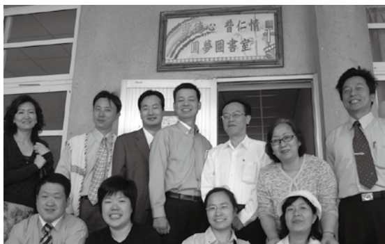
「歐德心 普仁情-圓夢圖書室」幸福啟用，這個幸福的空間成為孩子們最樂於駐足的場所。

我們非常感謝在歐德家具以及普仁基金會共同攜手下，一同讓這個夢想在充滿幸福的溫度中實現。感動的是在夢想實現的過程中，無論在書櫃的硬體設計規劃或是透過各門市募書的活動，甚至是募得書籍的分類整理以及上架，我們充分感受到歐德家具以及普仁基金會的用情用心，對原鄉地區的深切關懷。想要說的是這一份熾熱的幸福溫度，我們好真實的體驗到，我們絕對會盡情的擁抱這一份溫度，帶領著我們的孩子，透過閱讀，開啟更多的希望窗口，透過閱讀帶領著他們看見更開闊的未來。如果我們的絲毫努力，能夠給予孩子無盡的可能，那絕對是義無反顧的。對原鄉孩子而言，這將是無盡的生命價值的延續，構築了可以追尋的夢想天堂。