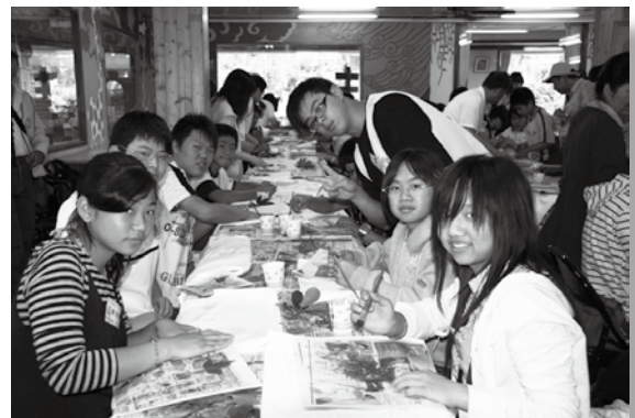
生長的家庭會影響孩子學校適應

許多外配婚姻因為丈夫肢體殘缺、老夫少妻、生活適應不良、溝通不良、個性意見不合、家庭經濟不佳、婆媳關係等等原因，常導致婚姻破裂、逃離家庭或家庭氣氛不佳，對其生下的孩子，生活適應及學業表現都將產生極大的負面影響。另一方面，缺乏