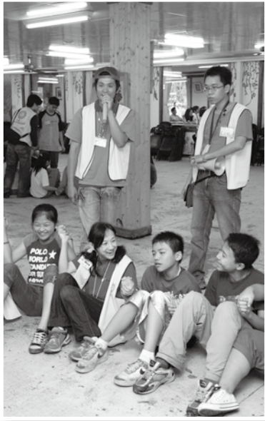
孩子們善良的面容，讓尚梅志工無法忘懷。

驗不只是智力、觀察力，更可看出團隊在互動中的和諧及分工合作等向度，雖上述這些看似「遊戲」，不知孩子們是否與我有同感，若是換成真實的生活場景（學校或是職場），是否我們仍能如此不畏懼地與他人和諧共融及分工合作?!