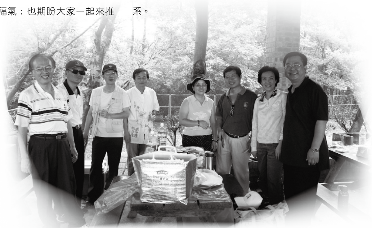
五四三聯誼會於文山農場的留影