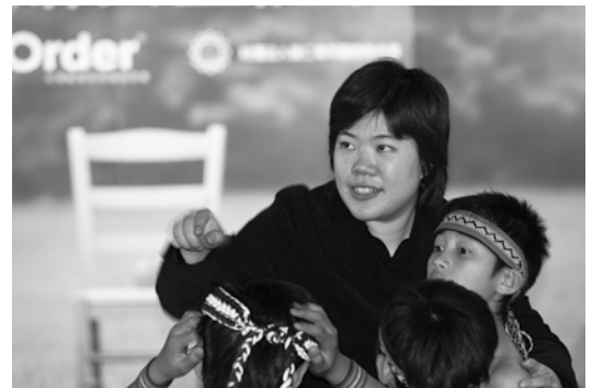
感謝孩子將簡單的幸福送到我們心中！

在這兩次的相見歡活動中，還有一群我敬佩更熱愛的伙伴，就是普仁專屬的幸福快遞員——志工團！這群人在天還沒亮的凌晨五點從台北集合出發，坐4個小時車的遊覽車到南投埔里，接著一天的活動後又再坐上4小時回到台北，雖然大家身體都疲憊不已（尤其是對一群平常日夜操煩家務的媽媽來說），但在活動現場，他們仍不斷地將愛與關懷送到孩子心中。或許你無法想像一天的活動能有什麼樣的「幸