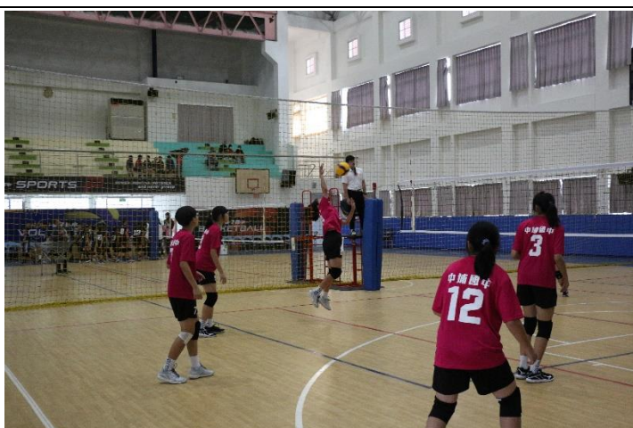
女排--嘉義縣中小學運