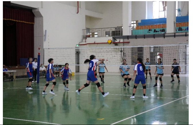
義竹對抗賽獲得首勝