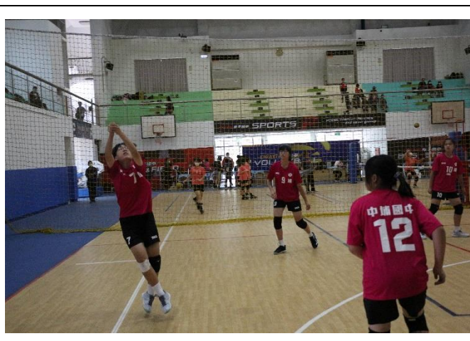
女排--嘉義縣中小學運