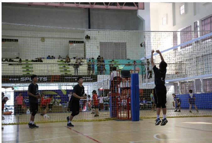
男排--嘉義縣中小學運