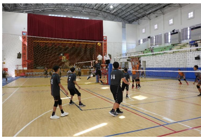
男排--嘉義縣中小學運