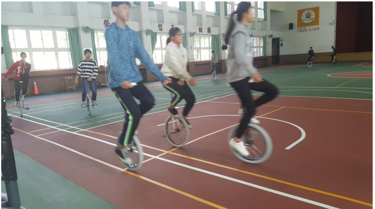
108 年 獨輪車 寒假育樂營 練習花絮