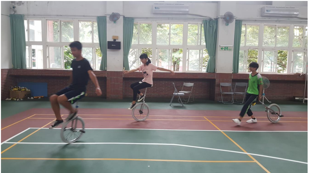
108 年 獨輪車 暑期育樂營 練習花絮 - - 推廣與集訓