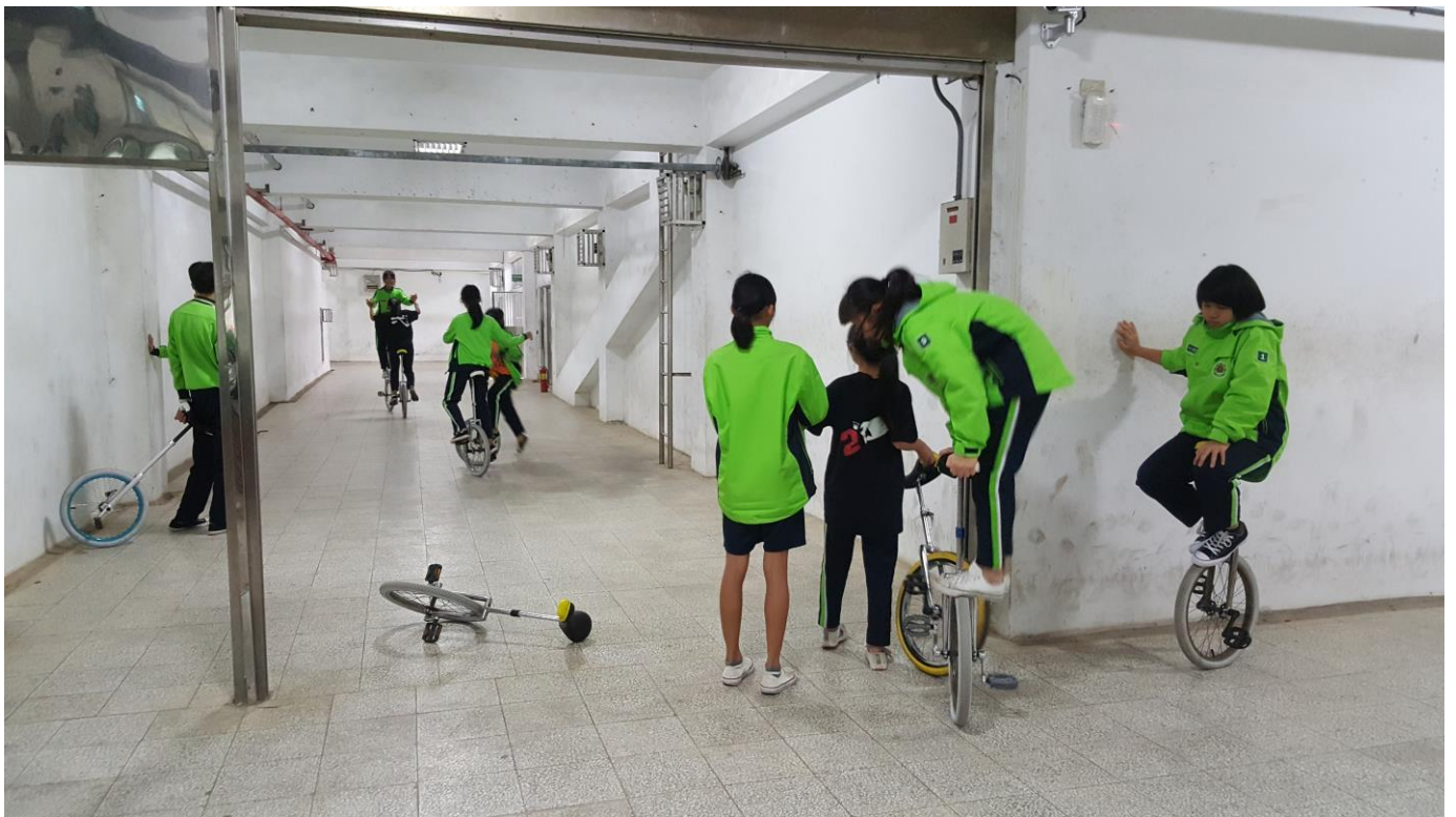
準備比賽，同學們都利用放學或假日都到學校練習