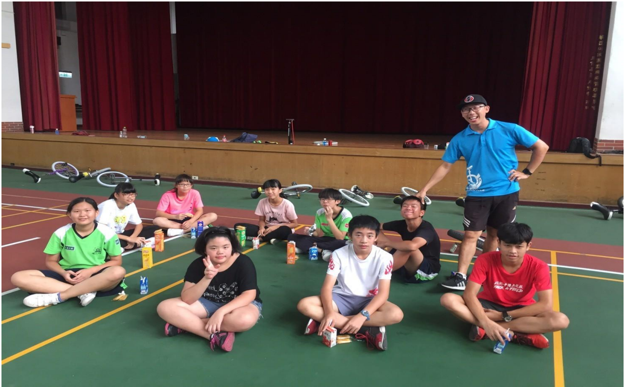
108 年 獨輪車 暑期育樂營 練習花絮 - 推廣與集訓