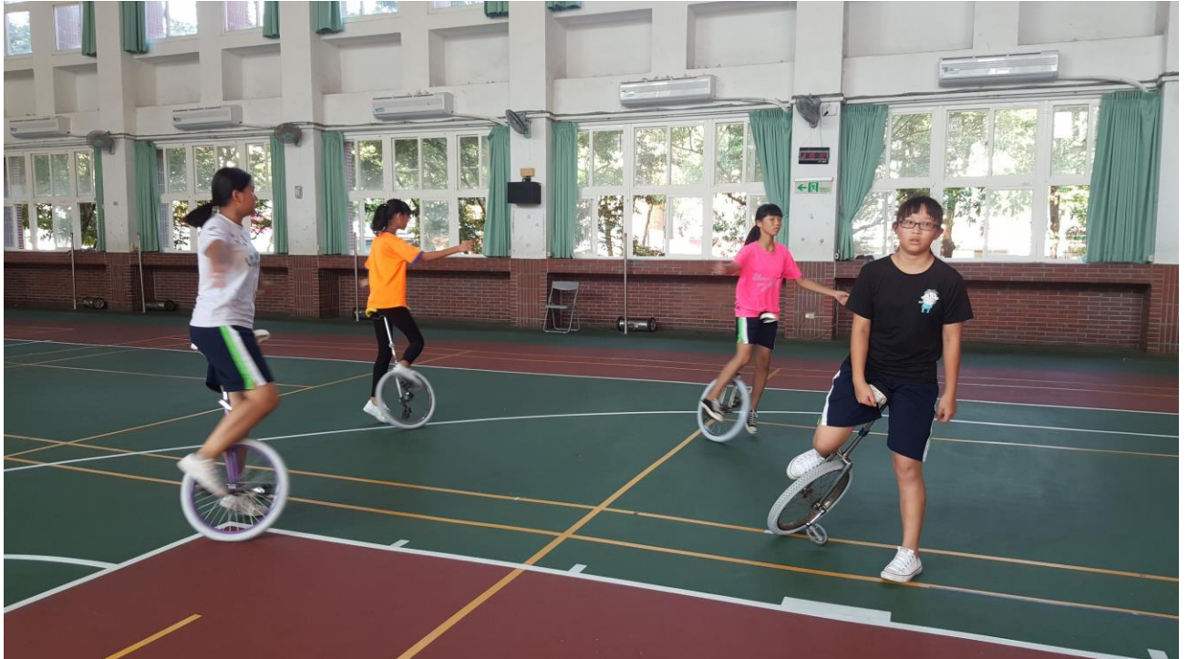
108 年 獨輪車 暑期育樂營 練習花絮 - 推廣與集訓