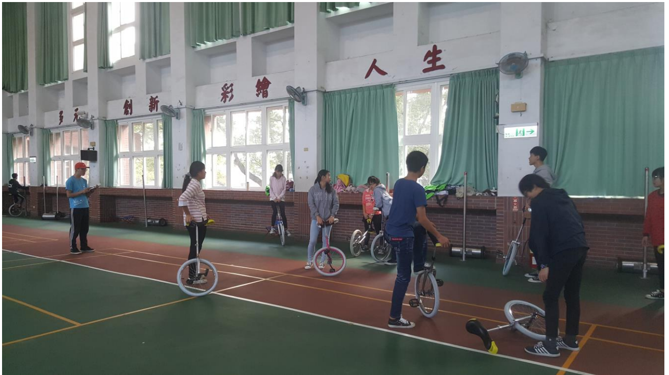
108 年 獨輪車 寒假育樂營 練習花絮