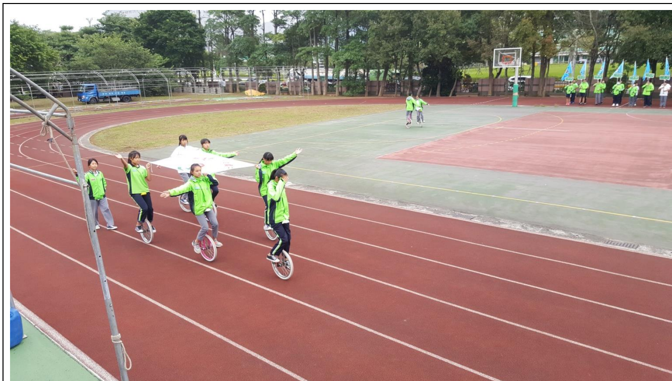
同學們利用放學或午休 練習運動會護旗進場工作