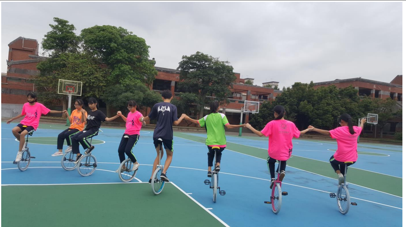
準備比賽，同學們都利用放學或假日都到學校練習