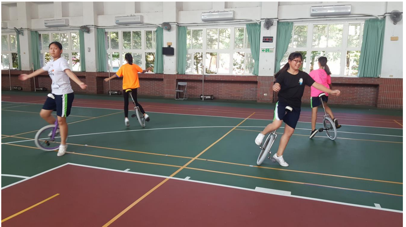
108 年 獨輪車 暑期育樂營 練習花絮 - - 推廣與集訓