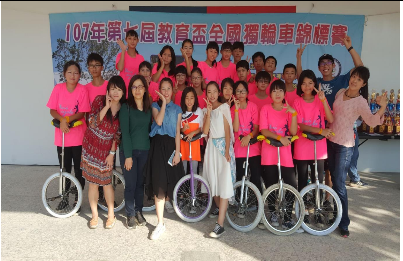
107 年 教育盃 全國獨輪車錦標賽