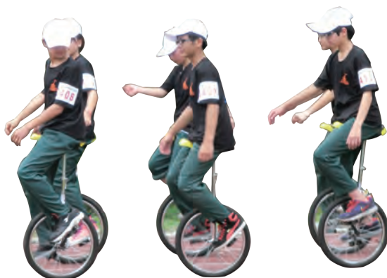
桃園縣大崗國中獨輪車~追風的少年